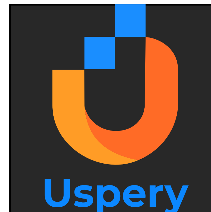
Não respeitar as margens de respiro