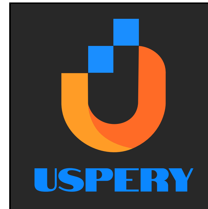
Modificar ou alterar as fontes