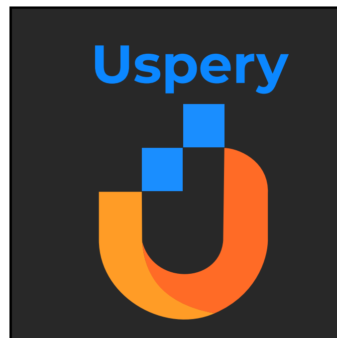
Inverter a ordem do logotipo