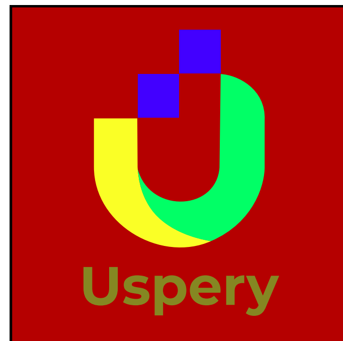
Colocar cores que não são da marca